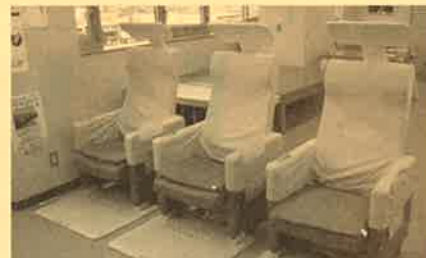
新しいヘルストロン「スカイウェル」

いきいきセンター3階でご利用いただいていた電位治療器「ヘルストロン」が4月より新しくなりました。名前も「スカイウェル」と新しく変わり、さっそく多くの方にご利用いただいております。効能効果(頭痛・肩こり・不眠症・慢性便秘の緩解)もヘルストロンと変わりなく効果を発揮します。開館時間内(月～金曜日の8:30～17:00まで)であればどなたでもご利用いただけますので、気軽にセンターまでお越しください。